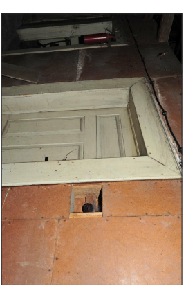
ZDJĘCIA SKRZYDŁA -widok z pom.2/1